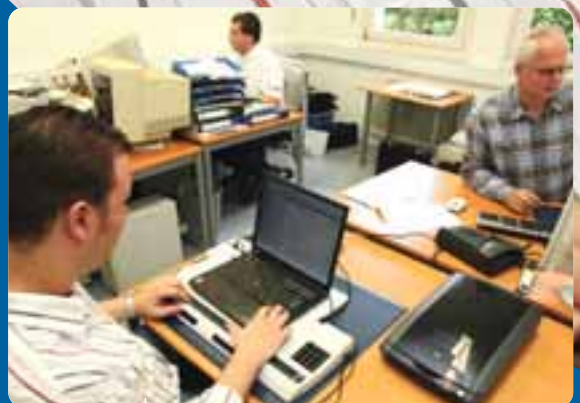
Notebook mit Braillezeile: Sie übersetzt digitale Texte in die Blindenschrift Braille.

„Ich beschäftige mich schon sehr lange mit Computern: Bereits in der Schule habe ich mit dem Notebook und der Braillezeile gearbeitet. Der Computer ist das Hilfsmittel überhaupt für mich. So lag es nahe, dass ich auch in diesem Bereich einen Beruf ergreifen wollte. Die entsprechenden Voraussetzungen – den Realschulabschluss – hatte ich. Ich habe mich viele Male beworben bis es dann bei Haake & Partner geklappt hat. Seit September 2005 mache ich jetzt dort eine Ausbildung zum Fachinformatiker für Anwendungsentwicklung.“